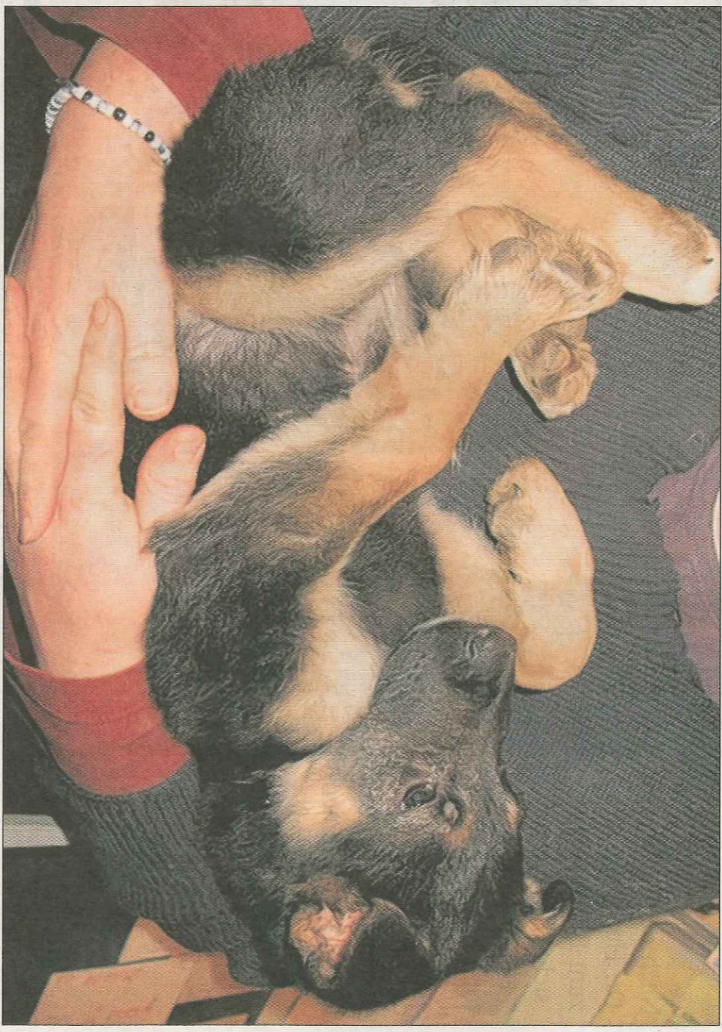
Nikki wird das süße Schäferhund-Baby im Tierheim genannt, das in einem zugeklebten Karton auf dem Exer gefunden wurde.

Nach dem Fest werden „lebendige Geschenke“ oft ausgesetzt, jetzt haben in Stormarn Unbekannte ihre Tiere auf grausame Weise schon vor Weihnachten „weggeworfen“. Oldesloes Tierschützer sind entsetzt und reagieren mit einem Vergabe-Stopp bis nach den Feiertagen.